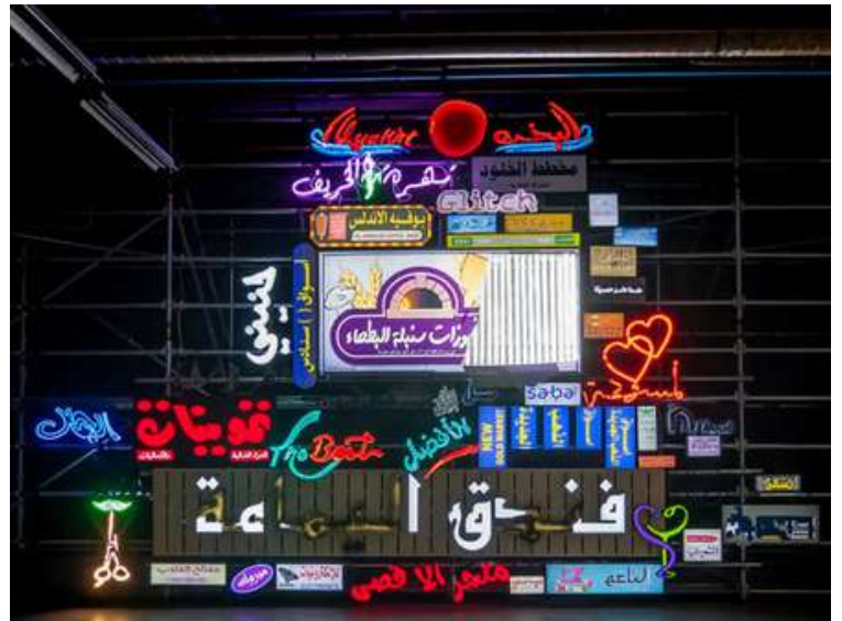
Where is My Mind? - Joana Hadjithomas et Khalil Joreige - 2020