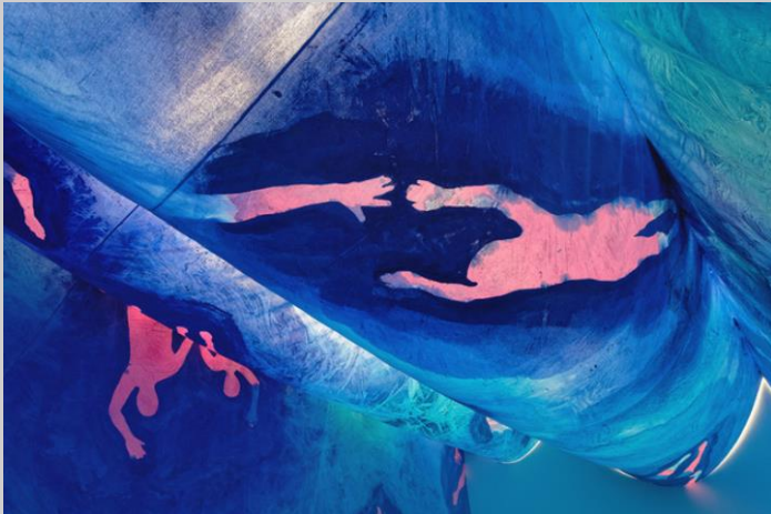
Charlotte Denamur, Rosées bleues (détail), 2019.