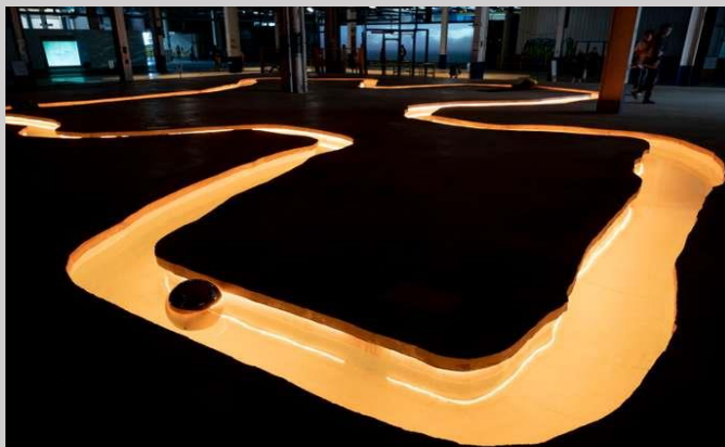
Minouk Lim, Si tu me vois, je ne te vois pas , 2019.