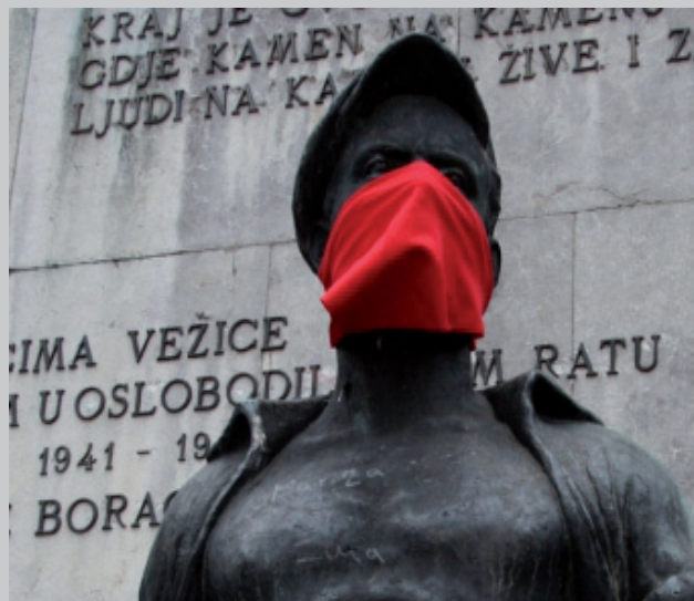
FIAC 2012/ Jardin des Tuileries (entrée côté Louvre), performance d'Igor Grubic, artiste « Zero Balkan Beat »

Au Jardin des Tuileries, un parcours artistique dans les espaces du jardin font dialoguer des artistes reconnus sur la scène internationale et création émergente.