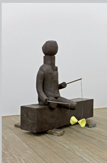
Sven'T Jolle (1996, Belgique) Diabolo - 2009. Pigment, plâtre, métal

> Bastille Design Center/ 74 bld richard Lenoir/ 75011/ Paris Métro Richard lenoir / St Ambroise/ Bastille