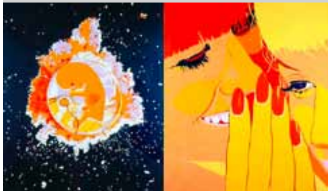
Bernard Rancillac, Filles capsules conciliabules 1966.