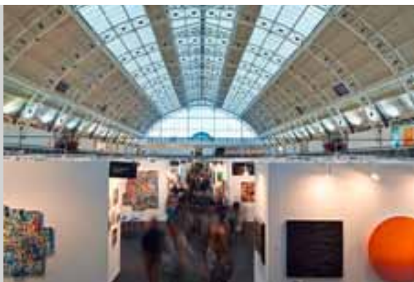
London Art Fair 2014