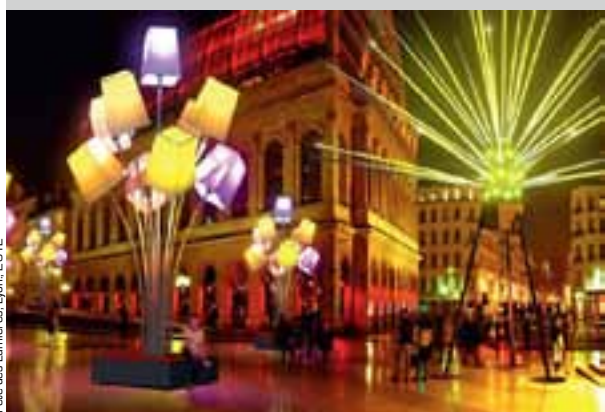
Fête des Lumières, Lyon, 2012

Comme vous le savez, à Lyon on ne badine pas avec la gastronomie. La Brasserie Georges est un temple de la cuisine tradilyonnaise - et directement sur la ligne de tram de la Maison de la danse... On y soupe à pas d'heure, mais il faudra réserver votre rond de serviette !