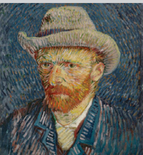
Vincent van Gogh, Self-Portrait with Felt Hat, 1888

Le musée vous permettra de suivre à la trace l'évolution de l'œuvre du maître et de comparer ses toiles avec celles des autres peintres du 19 e siècle que compte la collection. Le musée propose aussi de nombreuses expositions consacrées à divers thèmes de l'histoire de l'art du 19 e siècle.