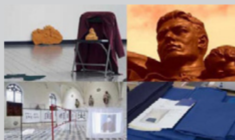
Prix de Rome, De Apple Art Center

Si la météo est favorable, faites une ballade sur le Prinsengracht (le «canal du Prince»), nommé ainsi en l'honneur de Guillaume Ier d'Orange-Nassau. C'est le plus long des quatre principaux canaux car celui-ci se trouve le plus à l'extérieur. Il est prolongé au nord-ouest par le Korte Prinsengracht et à l'Est par le Nieuwe Prinsengracht. Les principales curiosités sont la Noorderkerk (l'église du Nord), Noordermarkt (marché du Nord), le Musée de la Tulipe, la maison d'Anne Frank, la Westerkerk (l'église de l'Ouest), l'Amstelkerk, De Duif (l'église du prince).