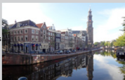
Prinsengracht (le «canal du Prince»)

http://www.concertgebouw.nl/concerten-en-tickets/van=29-11-2013/genre=Orkest