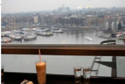
Vue ed Amsterdam Central Public Library