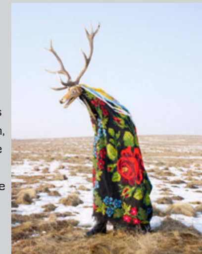
Cerbul din Confăta, Roumanie © Charles Fréger