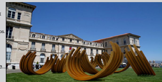
Bernar VENET, jardin du Pharo, MP2013

Marche artistique MP 2013 avec Delphine Maurant - Une traversée de Marseille du point de vue des oeuvres commandées à l'occasion de MP2013 : un détournement de la Canebière, un opéra noir, des bancs de sable... Nous arpenterons la ville à pied du quartier du Panier à Belsunce au Pharo en passant par le Vieux-Port. Nous y croiserons les oeuvres de Bernar Venet, Caroline Duchatelet, Cyril Neyrat, Pierre Delavie (le spécialiste international du « mensonge urbain » écrivait les Inrocks)... Notre déambulation sera ponctuée de visites de galeries d'art contemporain et de lieux alternatifs, en effervescence à l'occasion de ce week-end spécial « Printemps de l'art contemporain » ( www.marseilleexpos.com/?page_id=16772 ). Nous visiterons les expositions d' Harald Fernagu à la galerieofmarseille , Les bouts du monde de Régis Perray à la Galerie Gourvenec Ogor , Eeriness de Laurent Perbos au Passage de l'art et tellement plus encore... A la découverte d'une ville qui défend une scène singulière !