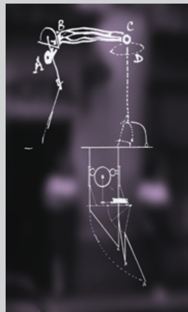
Marcel Duchamp, Soinneur de gravité, 1975

Tél : 09 67 09 27 65 / email : info@connaissancedelart.com