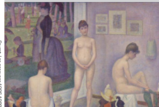
Seurat, Les poseuses, 1986-1988

il a rassemblé une exceptionnelle collection de toiles impressionnistes et postimpressionnistes : 150 Renoir, 69 Cézanne dont les Grandes Baigneuses , 60 Matisse et quelques dizaines de Picasso , sans oublier Monet, Toulouse-Lautrec, Van Gogh et, dit-on, l'un des plus beaux Seurat du monde, Les Poseuses .