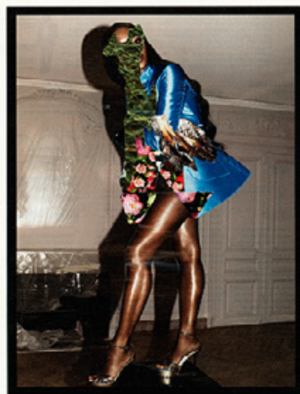
Dexter Sinister with Halmos, Watch Wyescan 05 Hz, 2012