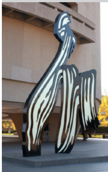
Roy Lichtenstein, brushstroke

> 7h10 Départ : Philadelphie 30th Street Station 9h10 Arrivée : Washington Union station Rendez-vous à la gare de la 30e rue (30th Street Station) munis de votre billet de train (achat en ligne en français sur amtrak.com).