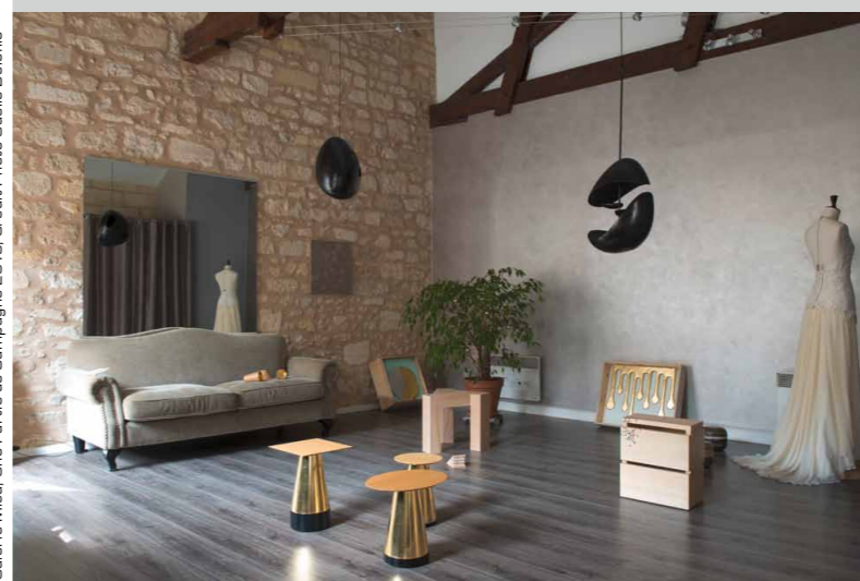
Galerie Mica, Une Partie de Campagne 2013.