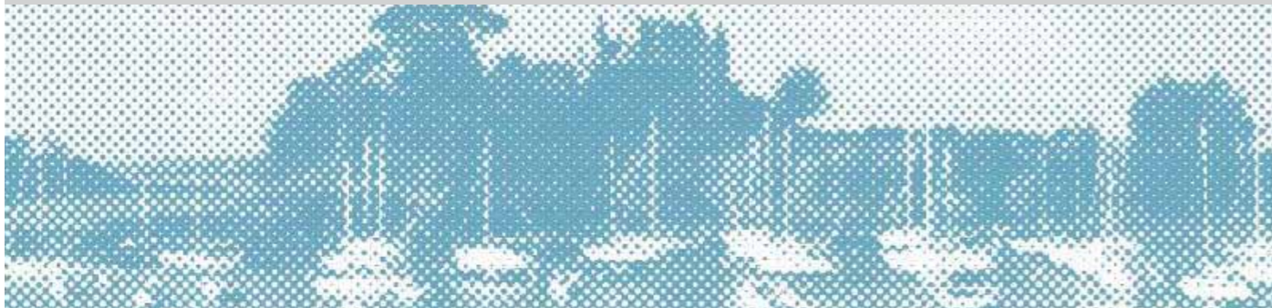
Graphisme Brice Tourneux

> Galerie Anne Barrault > Galerie Polaris > Galerie MICA > Galerie Ilan Engel > Galerie Bernard Jordan > Galerie Oniris > Galerie Jérôme Pauchant > Galerie Françoise Paviot > Galerie des petits carreaux > Galerie Réjane Louin