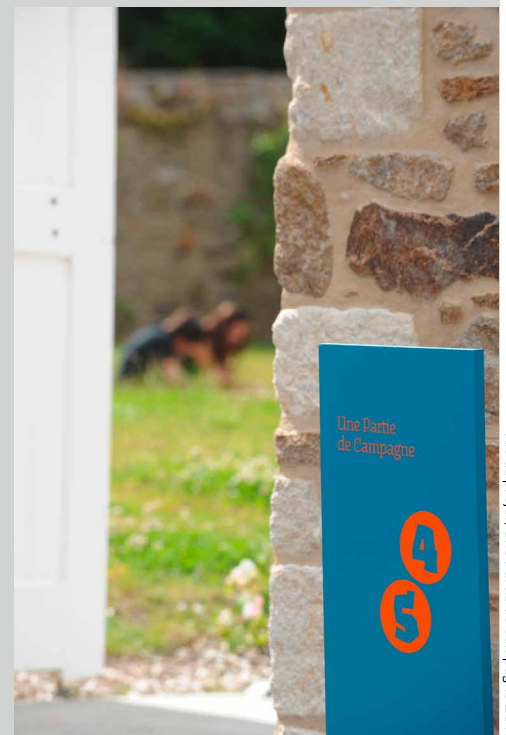
Vue du projet, Une Partie de campagne 2013

Connaissance de l'art contemporain • 127, boulevard de Ménilmontant • 75011 Paris • 16, place du Palais • 33000 Bordeaux