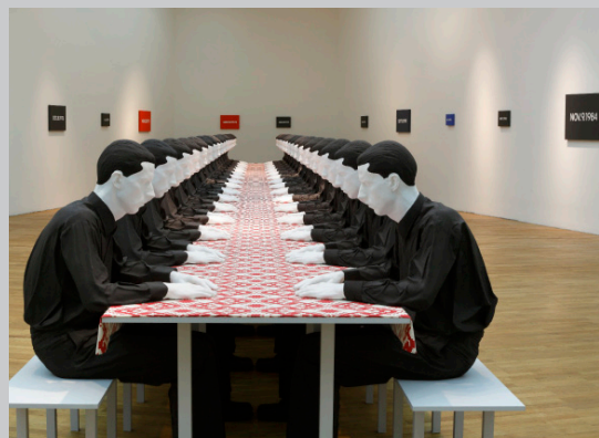
Katharina Fritsch's 'Tischgesellschaft', 1988 im MMK