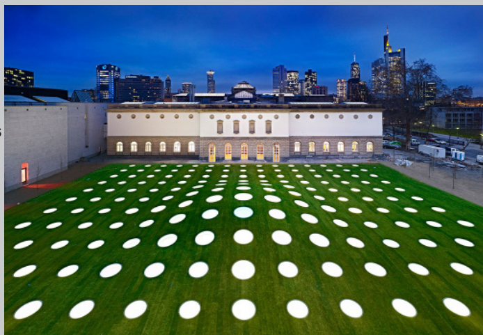
Städel museum, vue extérieure

Joyaux et cœur de la « Rive des musées », le Städel Museum est l'un des plus importants et des plus célèbres musées d'art en Allemagne. Sa collection permanente présente un panorama exceptionnel de l'histoire de l'art européen sur près de 700 ans, avec ses 2 700 peintures, 600 sculptures et 100 000 œuvres graphiques. Vous y découvrirez notamment une très belle sélection de peintures flamandes du XIV ème au XVIII ème siècle : Hans Holbein l'Ancien, Hans Holbein le Jeune, Matthias Grünewald, Altdorfer, Dürer, Rembrandt, Jan van Eyck et Vermeer . Nous visiterons ensemble les collections d'art moderne et contemporain installées dans la nouvelle extension souterraine qui couvrent les peintres romantiques du XIX ème tant allemands que français, et les plus grands de l'Impressionnisme et des mouvements abstraits du début du 20 e siècle : Monet, Cézanne, Edgar Degas, Henri Matisse jusqu'à Penck, Baselitz et Bacon .