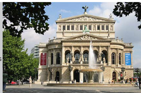
Theater de Francfort

Un petit déjeuner au marché ? Déambulez dans les allées du Kleinmarkthalle , le marché couvert de Francfort, et faites le plein de spécialités locales. Si le temps vous le permet, prolongez votre promenade sur les bords du Main, entre les ponts Untermain et Friedens , où chaque samedi se tient le Flohmarkt (marché aux puces). A moins que vous ne préfériez une balade matinale dans le quartier des affaires ? Arpentez les rues au pied des gratte-ciels, et découvrez quelques unes des plus hautes tours européennes comme la Commerzbank et la Meseturm . Ne manquez pas la Main Tower , la seule tour ouverte au public. Prenez l'ascenseur jusqu'à la plate-forme située à presque 200 mètres de haut pour profiter d'une vue imprenable sur tout Francfort.