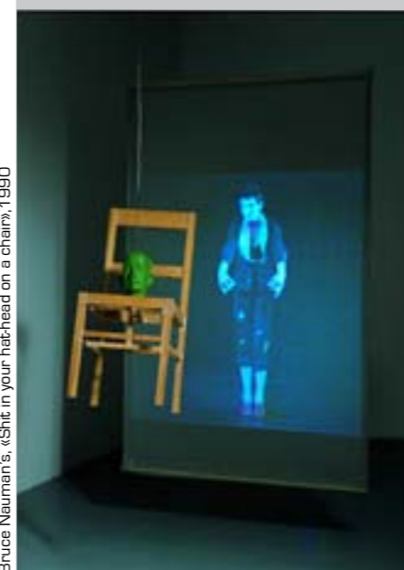
Bruce Nauman's, «Shit in your hat-head on a chair», 1990

Nous vous conseillons d'aller au Centre de l'image La Virreina qui présente l'exposition Les non-conformistes . Le photographe Martin Parr y dresse un portrait des villes du West Yorkshire au milieu des années 70. Avec son épouse, il monte un projet entre documentaire et reportage traditionnel. Le titre de l'exposition fait référence aux chapelles méthodistes et baptistes que l'on trouve dans cette région du Yorkshire et capture l'esprit d'indépendance de ces gens. Grâce à ses photographies, Martin Parr documente la vie quotidienne des mineurs, des ouvriers de la filature, des agriculteurs de montagne et de colombophiles. L'exposition présente 75 photographies en noir et blanc prises entre 1975 et 1980, brillante satire de la vie de ses contemporains.