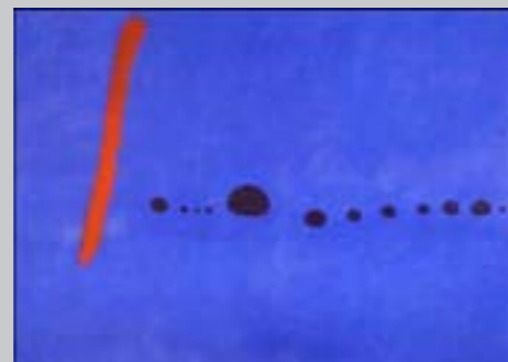
Joan Miró, Blue II, 1961