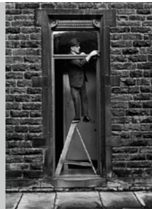
Martin Parr, 1975

Si vous venez pour la première fois à Barcelone - et si vous ne prolongez pas votre séjour - , le bus touristique est sans doute la meilleure façon d'aller voir les monuments de la ville et les sites d'intérêt majeur. Hop on, Hop off ! Rendez-vous au Parc Guell , chef-d'œuvre d'Art nouveau de Gaudí, tout en courbe et en céramique. Ou, faites un tour par le Barrio Gracia , quartier à la fois bohème et tendance, qui fut un village indépendant jusqu'à la fin du 19e siècle. On y retrouve une âme populaire et familiale et il fait bon s'y arrêter à la terrasse d'un café ! Plus au sud la ville, dans le Parc de Montjuic vous découvrirez la Fondation Mirò . Son architecture spectaculaire est l'œuvre de l'architecte Josep Lluís Sert , ami du peintre. Une partie des œuvres est exposée à l'extérieur où elles sont en concurrence avec une magnifique vue en surplomb de Barcelone. La Fondation expose également des œuvres d'autres artistes - principalement surréalistes - comme Calder, Rothko, Duchamp, Yves Tanguy, Ernst ou encore Balthus .