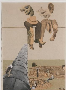
HANNAH HÖCH From above 1926 photomontage