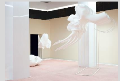
MARGUERITE HUMEAU FOX P2 2017

Impacté aussi par l'ère des technologies de l'information, chaque projet de Marguerite Humeau (1986) est le fruit de collaborations avec des chercheurs, anthropologues, paléontologues, zoologues, linguistes et ingénieurs. Grâce à ses recherches interdisciplinaires, cette artiste française réalise des œuvres sculpturales et sonores à grande échelle. Elle crée des univers étranges où la brièveté de l'existence humaine se trouve confrontée au temps cosmique et géologique.