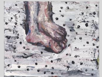
PHILIPPE VANDENBERG Étude d'après Caravage 2000/03 Huile sur toile 40 x 50 cm

Vitalistes sont les œuvres, peintures et dessins, de Philippe Vandenberg (1952-2009), artiste flamand dont c'est la première exposition personnelle dans un musée allemand. Le titre de l'exposition « Kamikaze » (vent divin) est aussi le concept central de l'artiste qui revendique l'acte autodestructeur. Tout au long de sa carrière, l'iconographie de Vandenberg s'appuie sur les symboles d'une immense littérature, de l'histoire de l'art, des récits bibliques, mythes et événements contemporains.