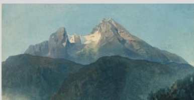
HEINRICH REINHOLD Der Watzmann, 1818 Huile sur papier 30 x 42.9 cm