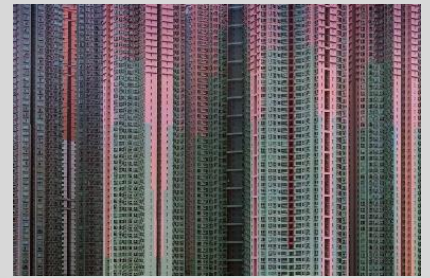
MICHAEL VOLF Architecture of density 2013

Élément incontournable de la ligne d'horizon du port de Hambourg, le Deichtorhallen . Ce sont deux anciennes halles de fer et de verre construites au début du 20 e siècle dédiées aujourd'hui à l'art contemporain et à la photographie. Notre horizon s'arrêtera sur les mégapoles de Hong Kong ou de Tokyo vu par ce photographe allemand (1954) qui étudie les phénomènes de massification avec humour et absurdité.