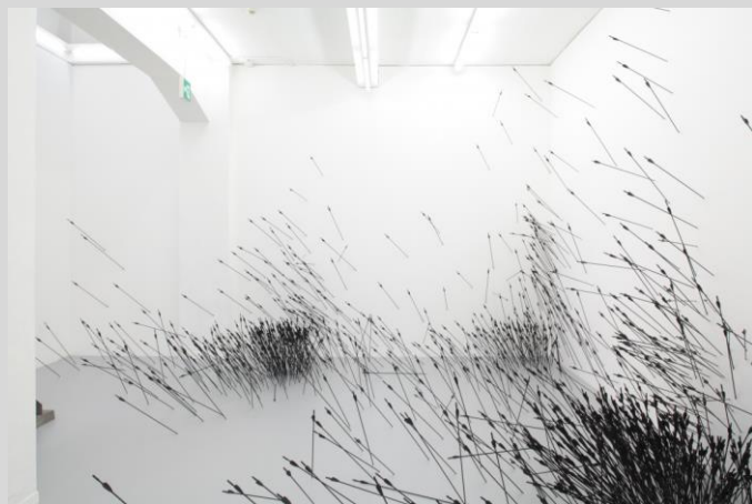
Ryan Gander, Ftt, Ft, Ftt, Ftt, Ftttt, Ftt, 2010.

> Distance intime. Chefs-d'œuvre de la collection Ishikawa.