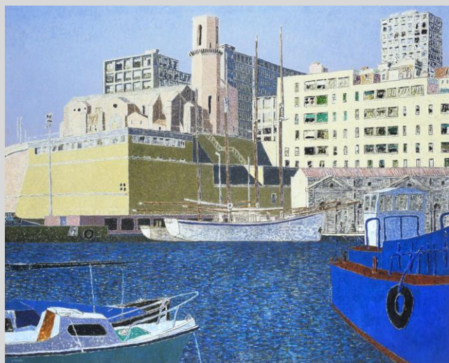
Vincent Bioulès, La Tourette I, février 1994-janvier 1995. Huile sur toile, 130 x 162 cm.

Principal musée de Montpellier, le musée Fabre a été créé en 1824 dans un ancien collège de jésuites du 17 e siècle puis rénové en 2003. Originellement constituée de la donation de François-Xavier Fabre , peintre, la collection considérable de tableaux et de dessins des périodes classique et néo-classique s'est étendue depuis à l'art moderne et contemporain, avec un don de 20 toiles de Pierre Soulages , des œuvres de Germaine Richier décédée à Montpellier et celles d'artistes du mouvement Supports/Surfaces dont beaucoup sont nés dans la région. Vincent Bioulès , montpelliérain né en 1938 est un de ceux-là. Chemins de traverse retrace son parcours en 200 peintures et dessins des années 50 à nos jours, un parcours traversé par une critique radicale de l'image