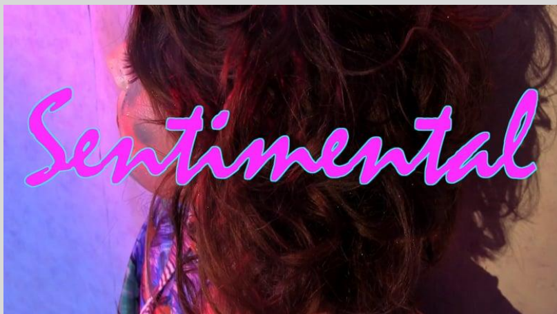
Quentin Goujout, Sentimental, 2018. La Panacée.

Toutes les informations pratiques sur les bulletins d'inscription .