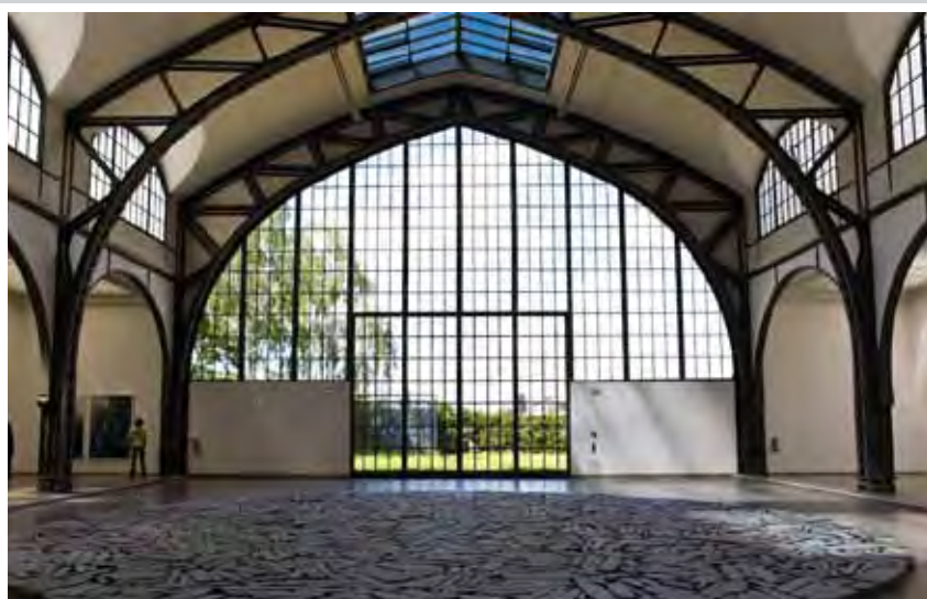
Aile du Hamburger Bahnhof.