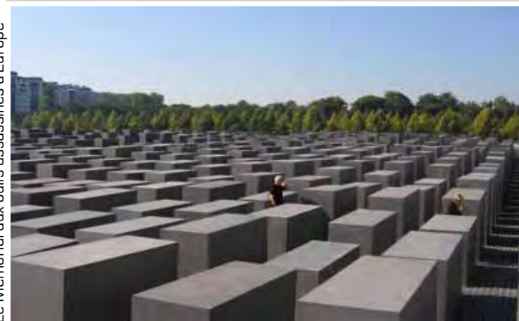
Le Mémorial aux Juifs assassinés d'Europe

Vous pourrez nous retrouver pour déjeuner et poursuivre nos échanges artistiques autour d'une bonne table.