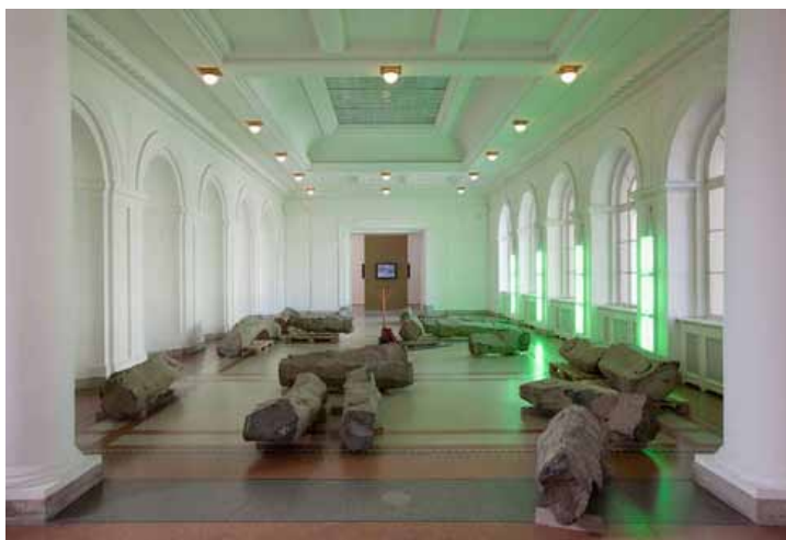
Joseph Beuys, 1982-83, la collection Marx