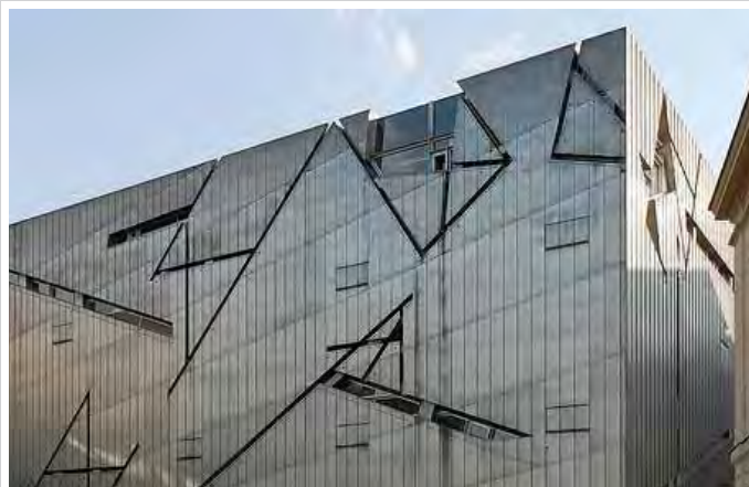
Musée des Juifs d'Europe.