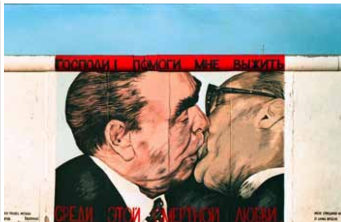
East Side gallery.

Vous pourrez rester à la Nouvelle Galerie nationale pour voir l'exposition Gehard Richter : Panorama en attendant son arrivée à Paris ( www.smb.museum/smb/kalender/details.php?objID=29733 ) ou vous rendre à deux pas au musée Martin-Gropius-Bau ou vous pourrez découvrir l'exposition Pacific Standard Time L'art à Los Angeles 1950-1980 qui présente des évolutions de la scène artistique de l'après-guerre à Los Angeles, ou l'exposition Noir sur blanc ? Art - Presse - Vérité . ( www.berlinerfestspiele.de/de/aktuell/festivals/11_gropiusbau/mgb_frz_ita_span/mgb_programm_frz/mgb_programm_frz.php )