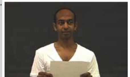
Brendan fernandes, Foe , 2008.