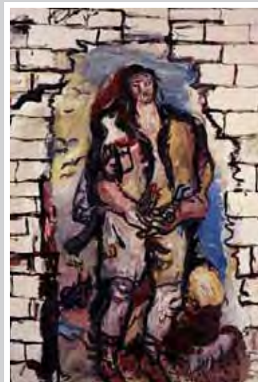
Georg Baselitz, Le père, 1966.