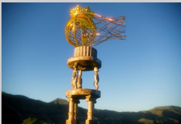
Olalekan Jeyifous - 12 Rencontres (partie I) - 2021. Sculpture en réalité augmentée.

Comme esquisse de réponse, le collectif berlinois Club social d'Omsk et le conservateur ghanéen-américain Larry Ossei-Mensah , sous la direction artistique de l'artiste et commissaire d'exposition basé à Athènes Poka-yio , sont allés puiser dans des œuvres de plus de 80 artistes d' Amérique du Nord et du Sud , des Caraïbes , d' Afrique et d' Europe pour convoquer à travers l'expérience de l'art, un espace de pensée et de réflexion. Aux pratiques rituelles en voie de disparition, aux créations de mondes alternatifs, s'additionneront les récits de voix artistiques contemporaines noires et queer, le tout ayant pour but d'activer un discours interculturel dynamique, spéculatif et radical.