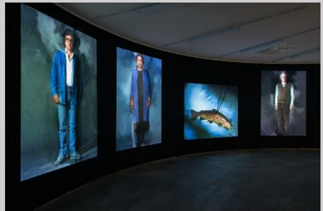
Costas Tsoclis – Portraits - 1986