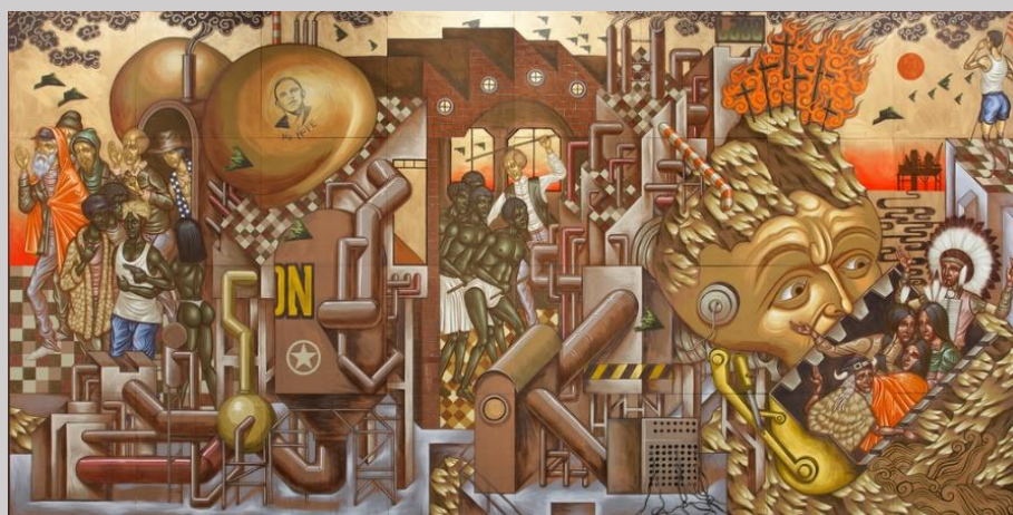
Stelios Faitakis, "The Legacy of Decline", 2011