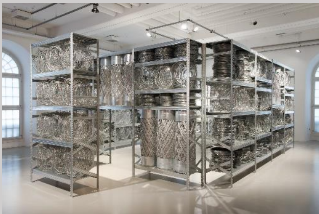
Kendell Geers - Akropolis Redux (The Directors Cut) - 2004.

Avec son ouverture en février 2020, le EMST , musée national d'art contemporain d'Athènes, comble une lacune majeure dans la toile culturelle de la ville. Après un parcours aventureux de près de 20 ans, 20 000 m 2 d'espaces d'exposition sont enfin dédiés à la sensibilisation du public à l'art contemporain. Dans cette ancienne brasserie, emblématique des années 1950 du quartier Koukaki , sont exposées 170 œuvres de près de 80 artistes. Sa collection d'artistes grecs et internationaux se répartit sur les axes thématiques suivants : Références de mémoire / Demandes / Récits politiques, Limites et passages, Hétérotopies / Mythologies du familier / Nouvelles perspectives. Entre des artistes comme Ilya Kabakov ou Marina Abramovic , des artistes grecs connus comme Jannis Kounellis ou Takis , provocateur comme Costas Tsoclis , nous voyagerons entre Orient et Occident, dans des eaux culturellement miscibles et foisonnantes.