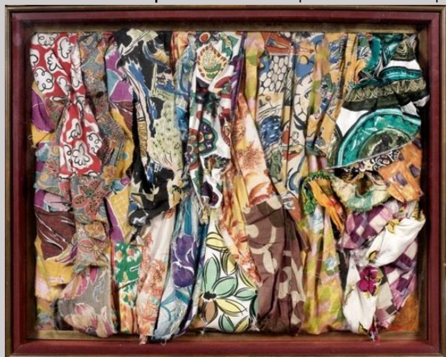
Gerard Deschamps - Fleurs de Hollande, 1963.

permet de vérifier cette affirmation. Plus d'une centaine d'œuvres datées de 1956 à aujourd'hui sont réunies pour célébrer la carrière de ce membre discret et facétieux du groupe des Nouveaux Réalistes dont le parcours à la fois chronologique et thématique – dédiant les quatre salles du premier étage à quatre aspects qui traversent la pratique de l'artiste depuis ses débuts – s'ouvre avec Fleurs de Hollande, accumulation de tissus imprimés datée de 1963 acquise par l'institution dunkerquoise en 2016, après plusieurs présentations du travail de l'artiste au cours d'expositions passées.