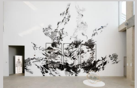
Abdelkader Benchamma – Vue de l'exposition

Comment apprivoiser l'étrangeté du monde ? Actant l'échec d'une approche trop rationnelle, l'exposition est un voyage qui nous invite à sonder ses mystères. Elle propose de découvrir le réalisme fantastique, mouvement majeur de la contre-culture des années 1960, à travers les œuvres d'artistes contemporains qui remettent en question les savoirs dominants et hybrident les connaissances scientifiques et ésotériques.